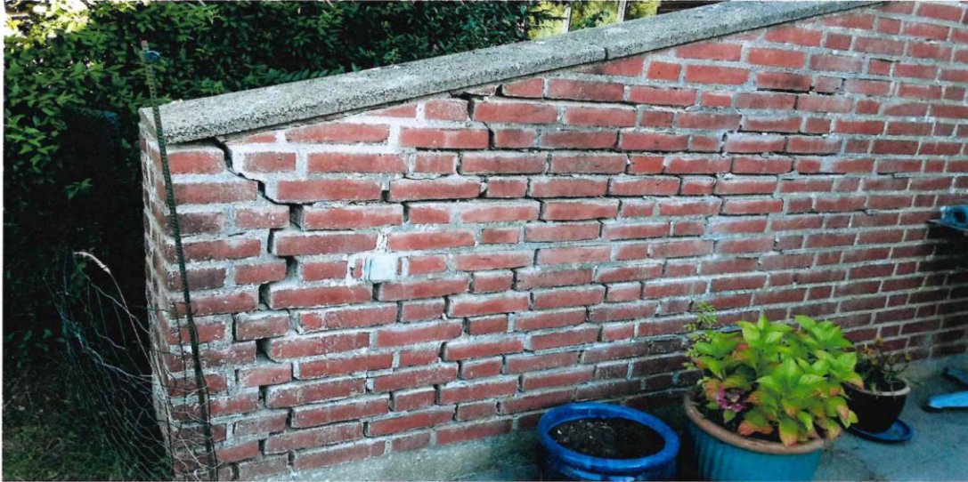
Billeder af læmure fra Kløvermarken